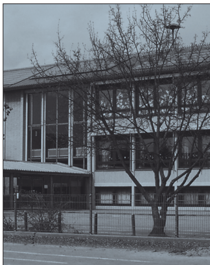
Hier funktioniert es: Contracting-Beispiel Schulgebäude

tracting-Anbietern moderne Heizungsanlagen in ihre Häuser einbauen. Die Eigentümer zahlen monatlich eine Gebühr für die Überlassung der Heizung sowie die anfallenden Heizkosten. Dieses Modell gilt als ökologisch und ökonomisch vorteilhaft. Im Vergleich zu alten Heizungen verbrauchen moderne deutlich weniger Energie. Zudem überwiegen die Heizkostenersparnisse die Kosten des Contractings. Das Modell leidet allerdings unter einem Mangel, den Mieter- und Vermietervertreter in seltener Einmütigkeit konstatieren: Contracting wird auf dem Wohnungsmarkt erst ab einer Wohnfläche von insgesamt mindestens 1.500 Quadratmetern angeboten. Erst dann kann es rentabel betrieben werden. Für wenigstens etwa 80 Prozent des Wohnungsbestandes in Deutschland – darunter das Wohnungsangebot privater Vermieter – ist die Unions-Idee damit irrelevant. Die von Angela Merkel zitierten Anreize „für den gesamten privaten Wohnungsbestand“ müssen folglich anders aussehen. Die Debatte dauert an.